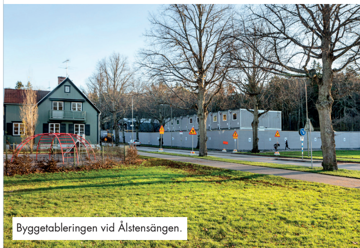
Byggetableringen vid Ålstensängen.