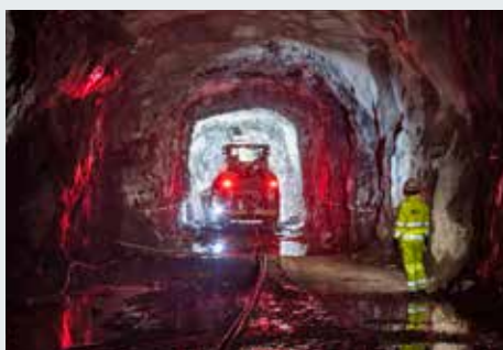
Mässtunneln byggs 50–80 meter under marken genom att borra och spränga. På bilden arbetar en borrhugg med att borra inför en sprängsalva.

Sannolikt har du som bor i området redan märkt av sprängningar från när vi bygger den nya avloppstunneln från Bromma till Sickla. Mässtunneln kommer att byggas på samma sätt genom att borra och spränga djupt nere i berget.